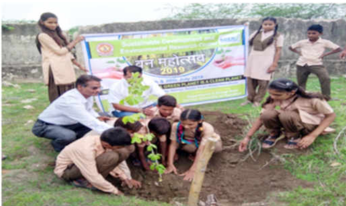
विभागीय गतिविधि के रूप में स्थानीय स्कूल में वृक्षारोपण

विभाग में भारत सरकार की विभिन्न एजेंसियों जैसे आईसीएसएसआर, डीएसटी और एनएचआरसीआई द्वारा अनुमोदित भारतीय रुपये 28.76 लाख की वित्त पोषित विभिन्न परियोजनाएं जारी हैं।