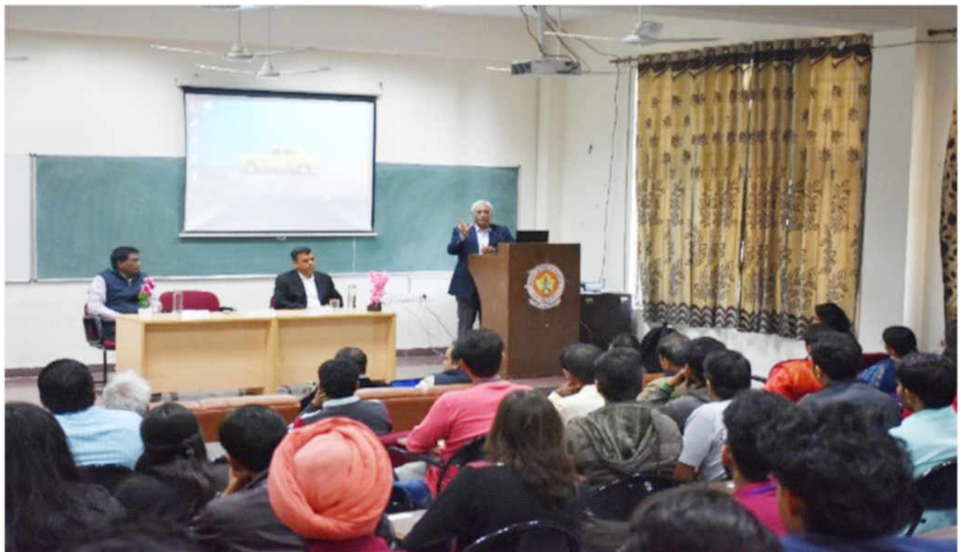
"ब्रेन एण्ड कम्प्यूटेशन: करंट ट्रेण्ड्स एण्ड फ्यूचर प्रोस्पेक्ट्स" विषय पर 14 फरवरी, 2020 को आयोजित कार्यशाला के उद्घाटन सत्र के दौरान