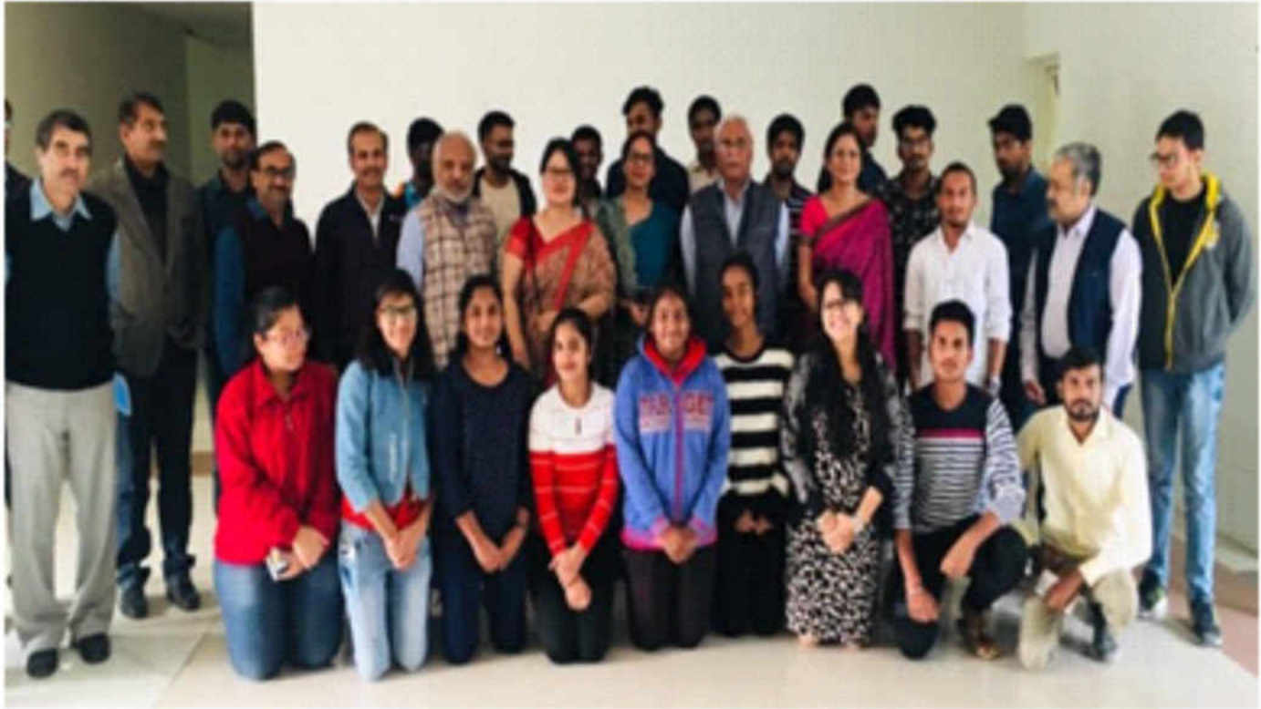
भाषाविज्ञान विभाग के उद्घाटन पर माननीय कुलपति के साथ भाषाविज्ञान विभाग के विद्यार्थी एवं संकायगण