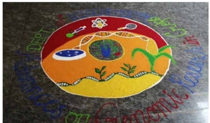
एडवांसेज ऑफ जियोनोमिक्स रिसर्च इन क्रॉप्स पर एक दिवसीय संगोष्ठी