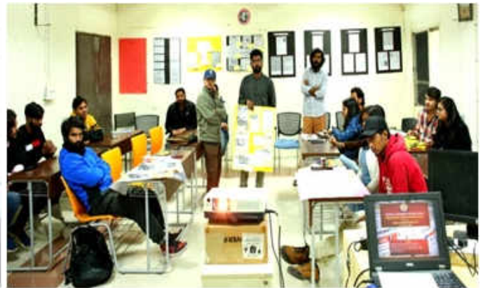
भारतीय समाचार पत्र दिवस (29 जनवरी, 2020) में भाग लेने वाले छात्र-छात्राएँ