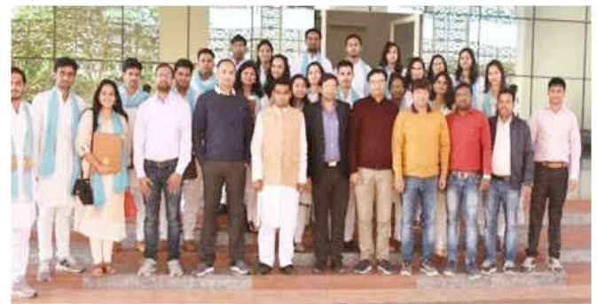
भौतिकी विभाग में वार्षिक गतिविधियाँ