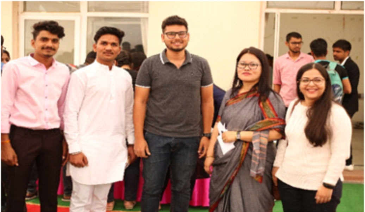
भाषाविज्ञान विभाग में आयोजित कार्यशाला में संकाय एवं विद्यार्थीगण