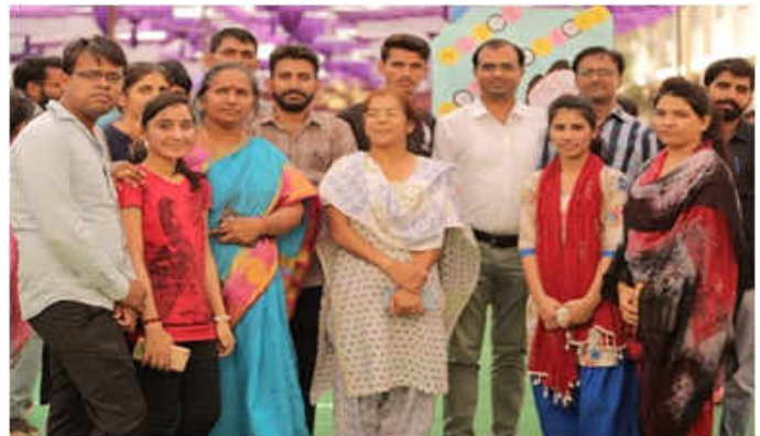
हिन्दी विभाग में विद्यार्थियों के साथ विचार-विमर्श