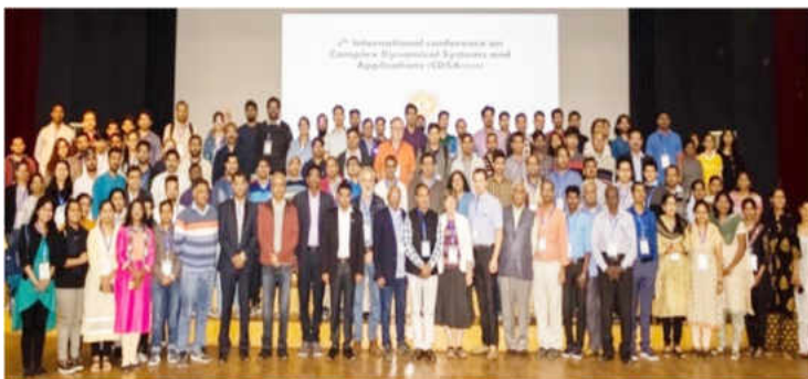
20-23 फरवरी, 2020 को कॉम्प्लेक्स डायनामिकल सिस्टम्स एंड एप्लीकेशन (सीडीएसए 2020) पर छठा अंतरराष्ट्रीय सम्मेलन