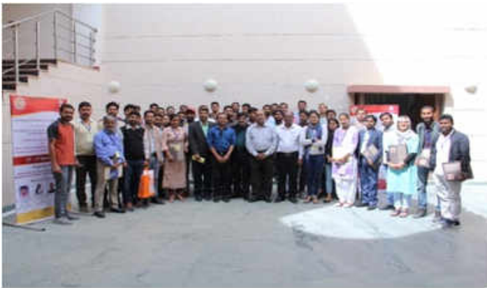
डीएसटी राष्ट्रीय कार्यशाला का आयोजन (13-15 मार्च, 2020)