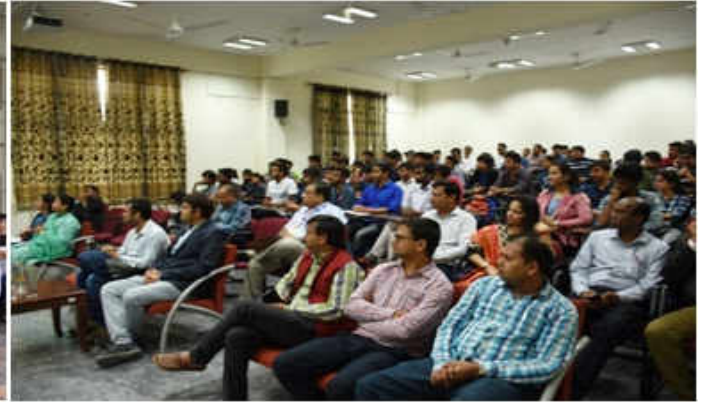
विभागीय पाठ्येत्तर गतिविधियाँ (सेमीनार प्रस्तुतीकरण)