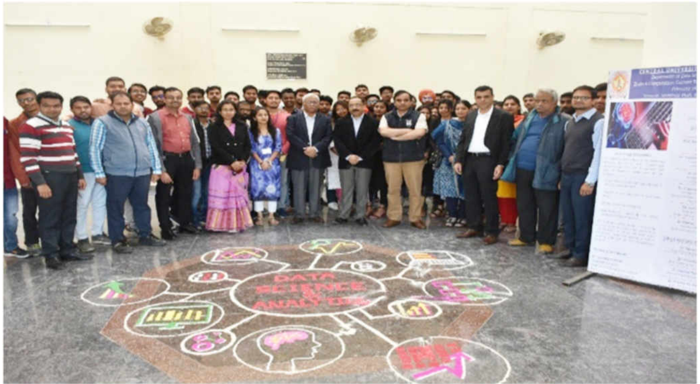
"ब्रेन एण्ड कम्प्यूटेशन: करंट ट्रेण्ड्स एण्ड फ्यूचर प्रोस्पेक्ट्स" विषय पर 14 फरवरी, 2020 को आयोजित एक-दिवसीय कार्यशाला में प्रतिभागी एवं आमंत्रित अतिथि