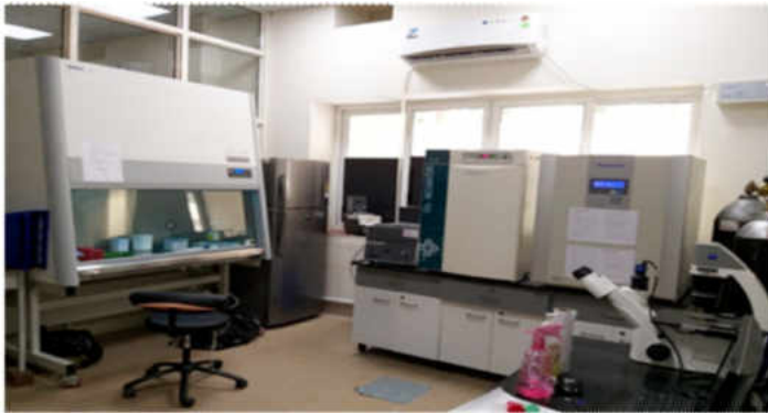
एनीमल सेल कल्चरल फेसिलिटी