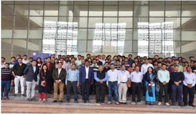
विषय "सिक्यूरिंग दि स्मार्ट सिटीज विथ दि इंटरनेट ऑफ थिंग्स (आईओटी) एण्ड ब्लॉकचैन" पर तीन दिवसीय राष्ट्रीय स्तर की कार्यशाला