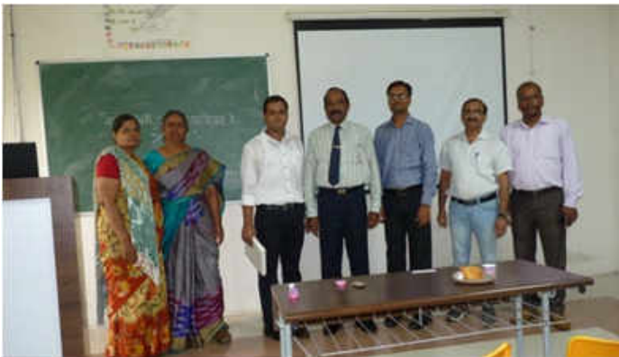
हिन्दी विभाग में प्री-पीएचडी जमा करने हेतु सेमिनार