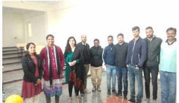
शैक्षणिक और अशैक्षणिक स्टाफ सदस्य