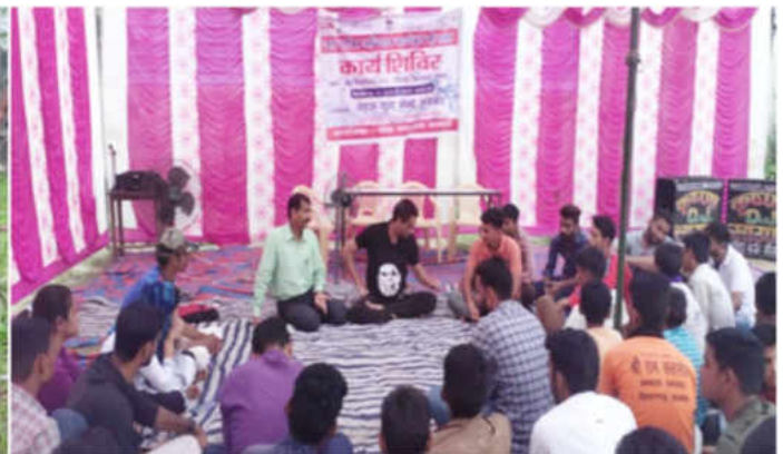
गाँव में जल संरक्षण पर युवा कार्यशाला